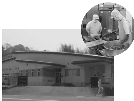
西能美学校給食共同調理場