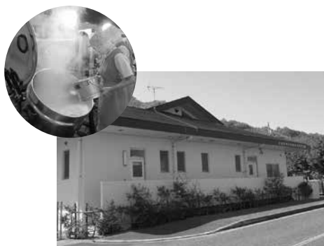
江田島学校給食共同調理場