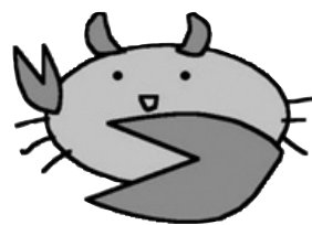
さとうみ科学館マスコットキャラクター 「シオマネキちゃん」

施設名 大柿自然環境体験学習交流館(さとうみ科学館) 所在地 江田島市大柿町深江 1073 番地 1 連絡先 (TEL) 0823-57-2613 (FAX) 0823-40-3100 (e-mail) satoumimail@yahoo.co.jp (HP) http://www.urban.ne.jp/home/fukaesho/SSM/