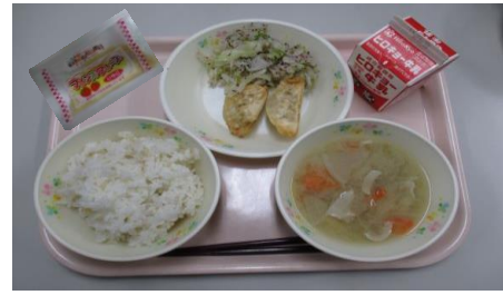
三高小学校6年献立