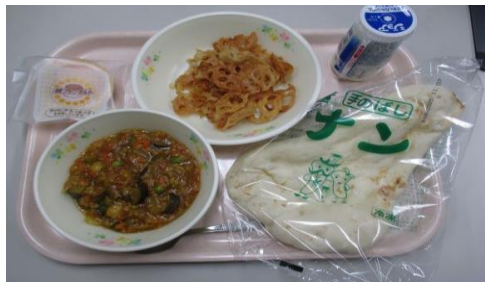
大古小学校6年献立