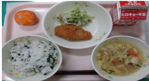
中町小学校6年献立

1月は、江能分級・三高中3年生・江田島中3-1・能美中3-1です。お楽しみに！！