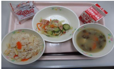
鹿川小学校6年献立