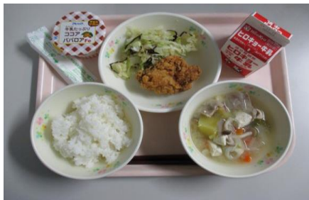
切串小学校5・6年献立

どの学校の献立も人気で、美味しくいただきました。2月までリクエスト献立続きます。どんな献立が登場するか楽しみにしていて下さいね。