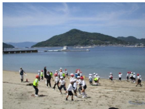
長瀬海岸「カブトガニの危機」(おにごっこ)