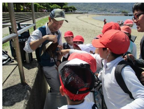
生きたカブトガニとのふれあい