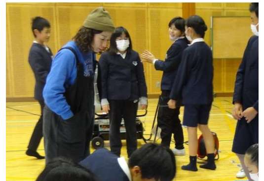
オブジェ制作のワークショップ