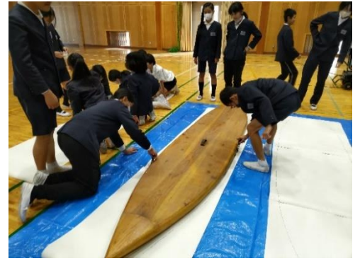
オブジェ「ココロヒカレ」 welcome ボードの制作