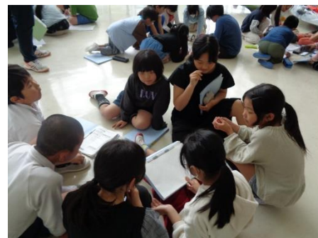
1回目の3～6年生の打合せ