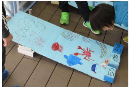
おもりにビー玉を使ったころころりん