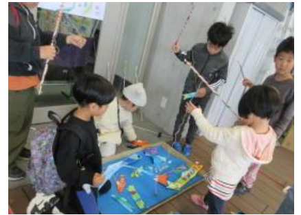
くつつく実「オナモミ」を使ったさかなつり