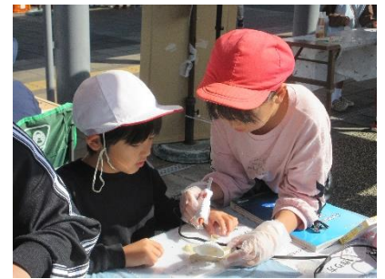
マルシェでのワークショップ