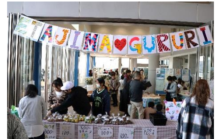
みたかゲートハウスでのイベント