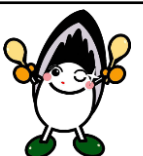
江田島市の食育キャラクター「もりもりぼうや」

1年間、学校給食の運営につきましてご理解とご協力をいただきありがとうございました。