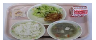
江田島中リクエスト給食 1/29

2/17(火) ビビンバの味がしっかり濃く、噛めば噛むほどあふれる旨味に震えました。ありがとうございます!(能美中3-1)