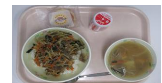
大柿中リクエスト給食 2/17