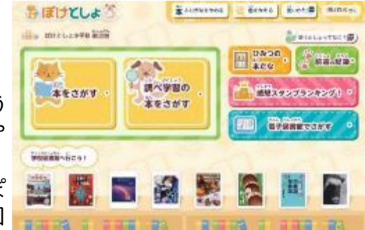
「TOOLi-Sタブレット版 ぼけっと図書館」の画面

これまで、学校の図書の貸出は代本板を用いたり、蔵書管理もExcel等を用いて行っていました。今回、図書館流通センターの「TOOLi-S」という蔵書管理システムを導入することとし、蔵書管理や貸出・返却作業の電算化を行いました。併せて、児童生徒用に「TOOLi-Sタブレット版 ぼけっと図書館」を導入。自分のパソコンから学校図書館の図書検索やお勧めの本の紹介などができるようになりました。